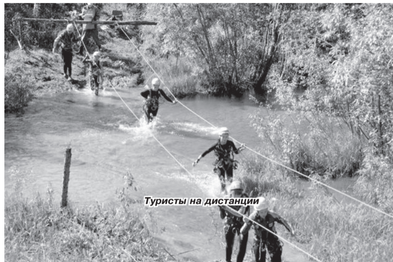
Туристы на дистанции

11 августа вся страна – надеемся, широко – отметит День физкультурника. Комитет по физической культуре и спорту поздравляет всех горожан и жителей села с этим праздником, который когда-то по праву считался всенародным. Судя по событиям последних лет, его популярность – как следствие внедрения нового комплекса ГТО и роста массовости физкультурно-спортивного движения в стране – стала расти. Всё больше людей надевают крос-