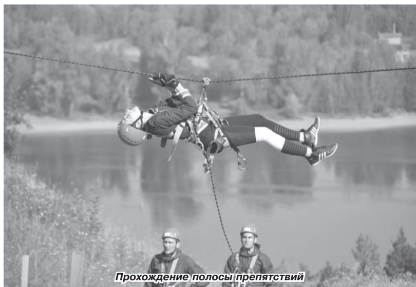
Прохождение полосы препятствий

чапушки, были даже танцы. После долгих раздумий и совещаний победа досталась команде ООО «Газпром трансгаз Чайковский». Среди