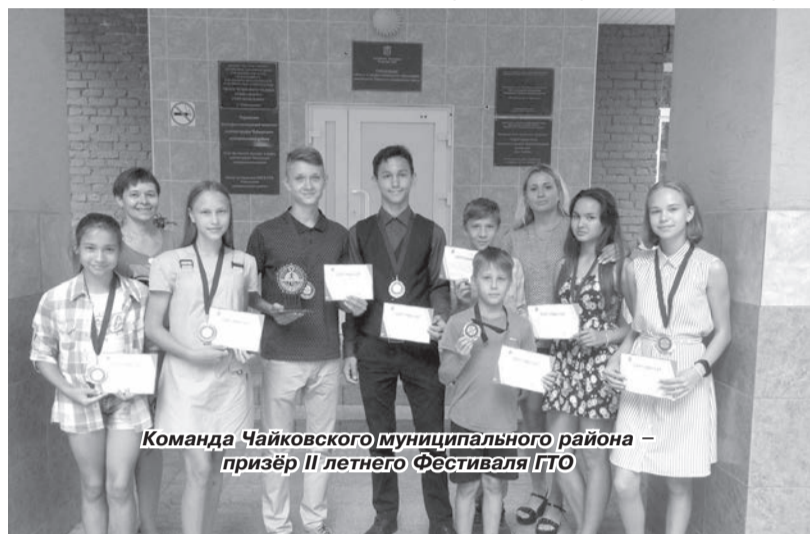
Команда Чайковского муниципального района – призёр II летнего Фестиваля ГТО

По результатам регионального этапа Фестиваля ГТО будет сформирована сборная команда Перм-