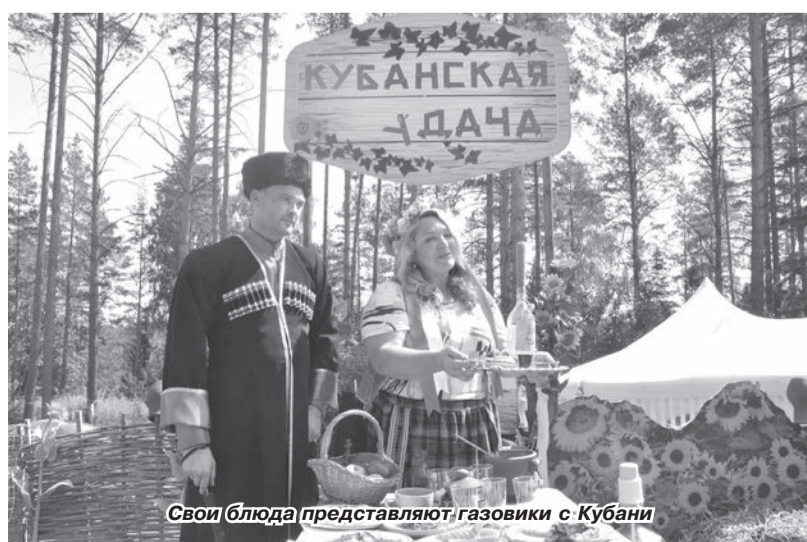
Свои блюда представляют газовики с Кубани